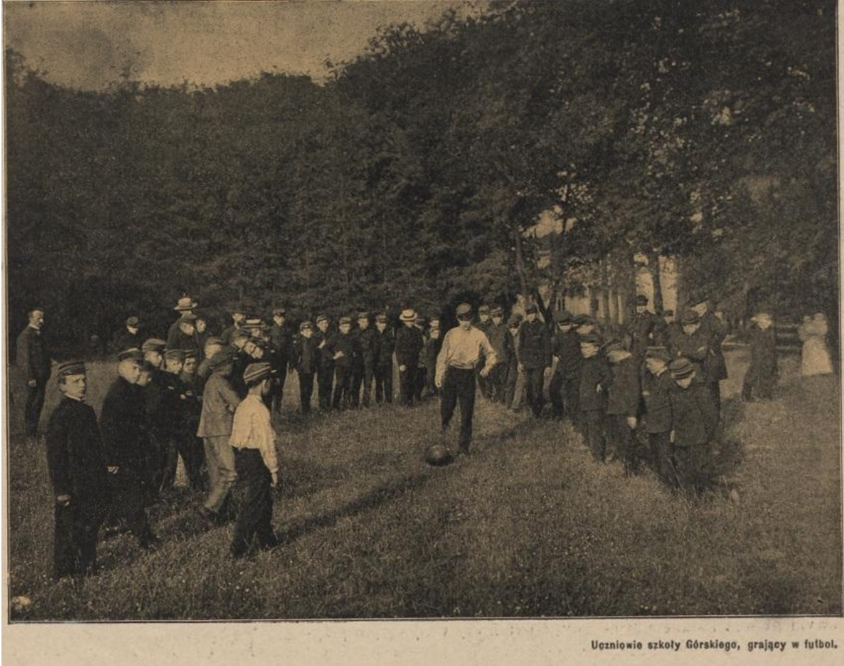
Świat nr 45 z 10.11.1906, s. 8